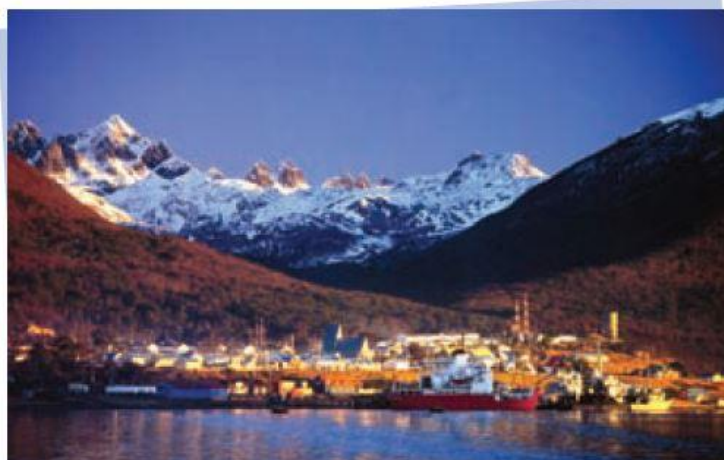
► Ciudad de Puerto Williams.

En la Zona Sur y especialmente en la Zona Austral, las condiciones del relieve y lo alejadas que están las ciudades unas de otras hacen más difícil el transporte y la comunicación . Existen lugares a los que solo se puede llegar en barco o en bote y otros, donde los caballos son fundamentales para acceder a ellos.